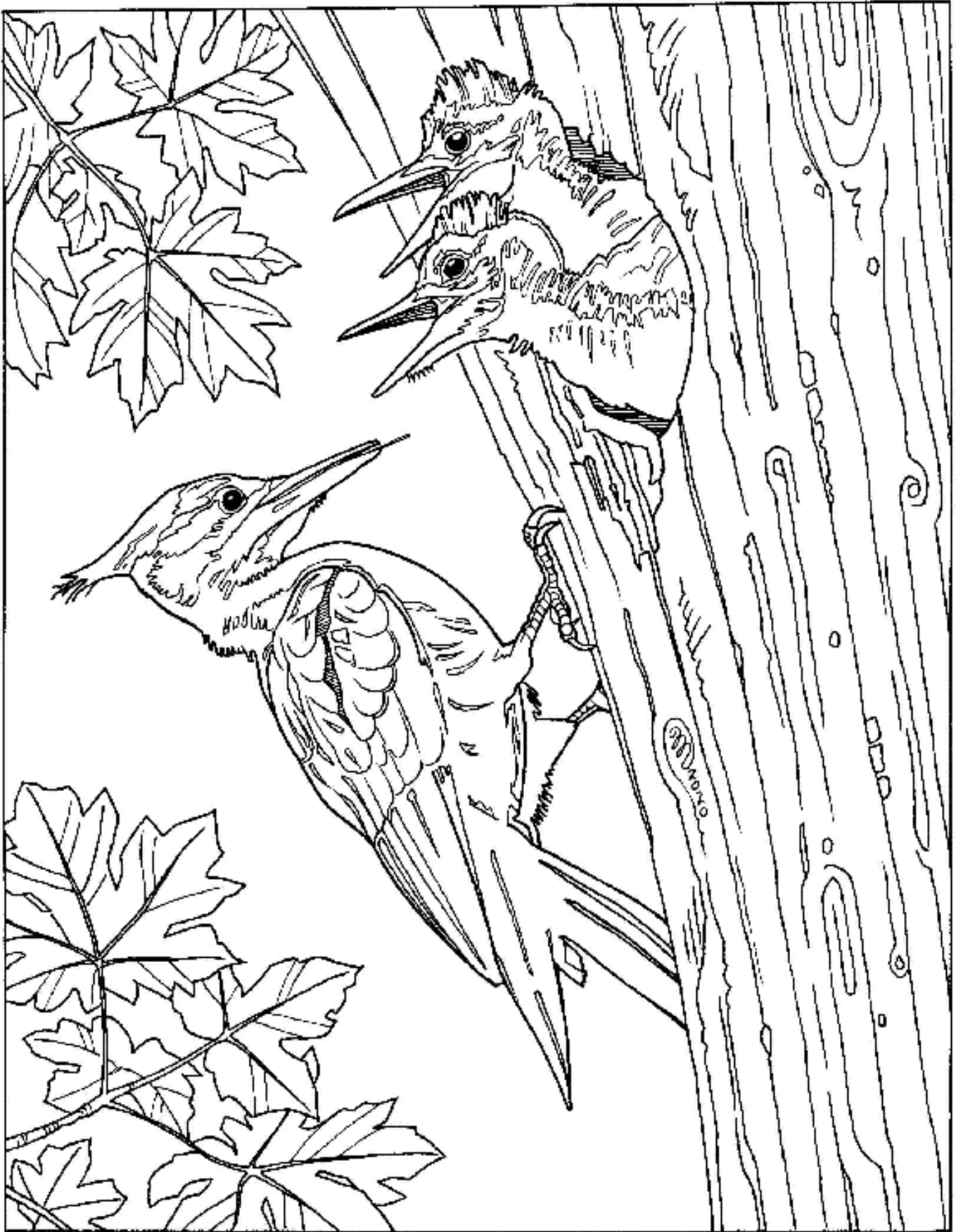
Pileated Woodpecker – Pájaro Carpintero Pileado