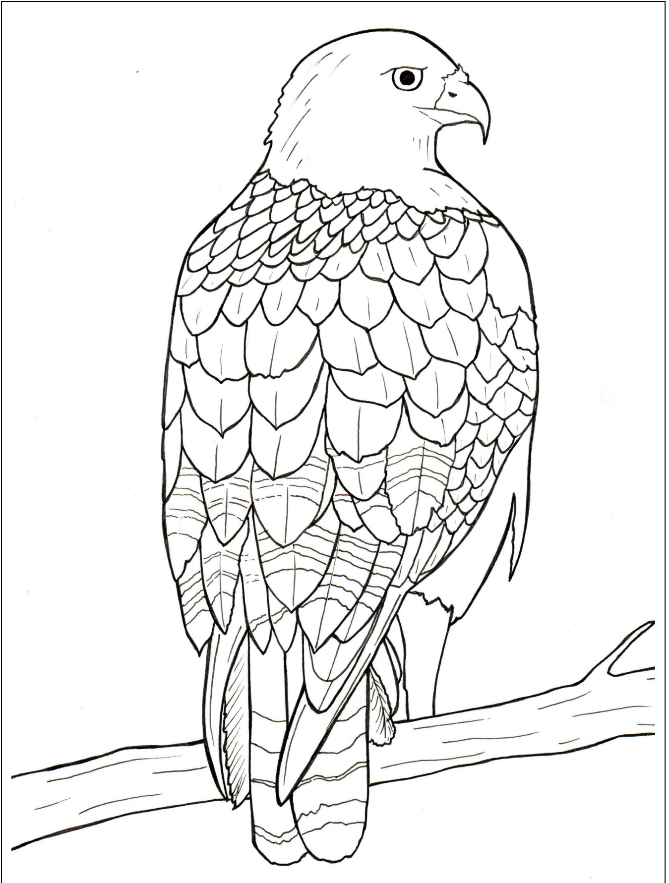
Red-tailed Hawk – Halcón de Cola Roja