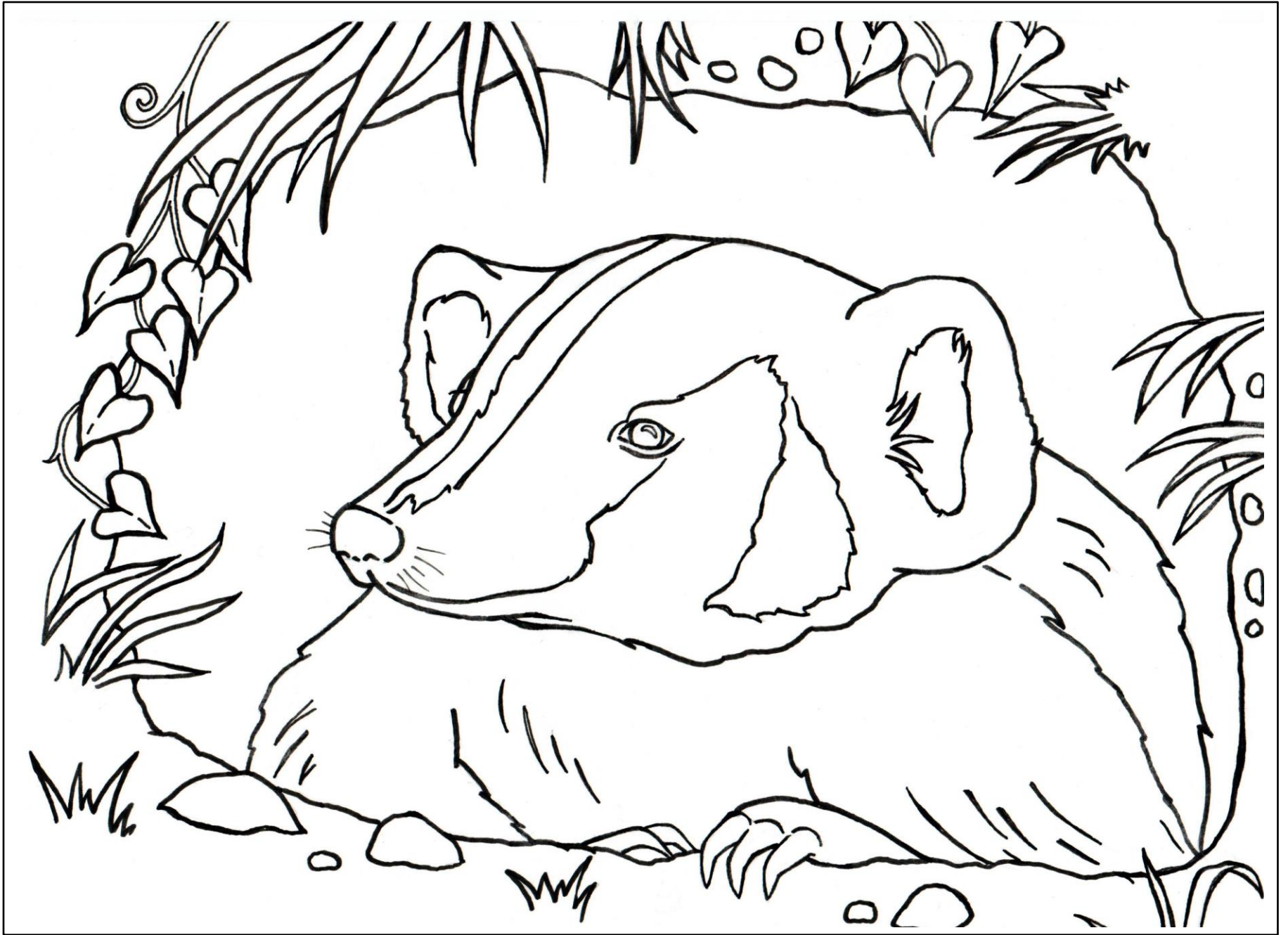
American Badger – Tejón Americano